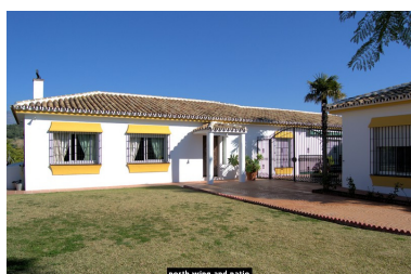
north wing and patio