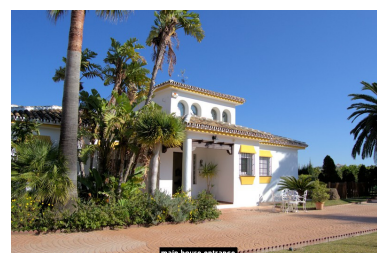
main house entrance