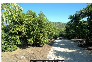
avocado plants with olive trees behind