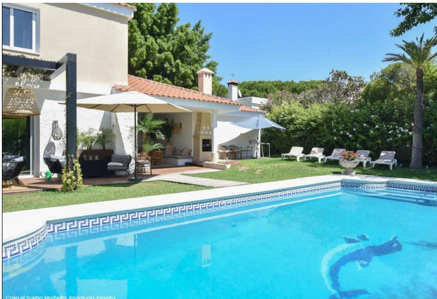
Casa el Sueño: Marbella, Andalucía, España.